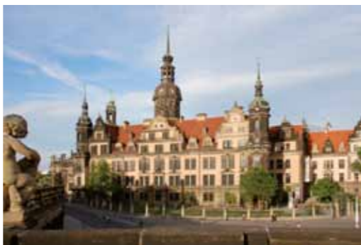
фотографии: D. Brandt, E. Estel/H.-P. Klut, J. Karpinski, N. Millauer, M. Fiedler, J. Lösel, A. Malschewski, H. Boswank, I. Hänse, H. Krass, E. Winkler, St. Augustin оформление: www.buero-quer.de; издано Государственными художественными собраниями Дрездена: © Staatliche Kunstsammlungen Dresden, май 2014 года, с правом на изменения

Дворец-резиденция (Residenzschloss), Ташенберг 2 (Taschenberg) / угол Шлосштрассе (Schlossstraße), 01067 Дрезден ежедневно с 10 до 18 ч.; предварительная продажа билетов в Исторические Зеленые Своды